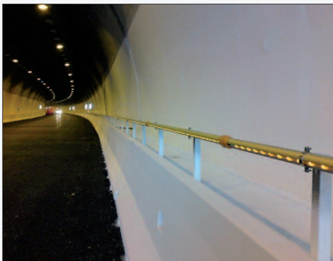
Figura 2 - La galleria Carestia sulla A24 (Teramo)

Per quanto riguarda i tunnel di nuova costruzione, si sta cercando di trovare soluzioni alternative alla riverniciatura annuale dei piedritti, utilizzando pitture lavabili che garantiscano una pulizia immediata mediante rotolavaggio. Tuttavia, le pareti dei tunnel in conglomerato cementizio gettato in opera presentano pori, irregolarità superficiali, crepe tra i punti di giunzione di conci consecutivi, ecc.. Luoghi ideali per lo smog che si accumula una volta aperta la galleria al traffico.