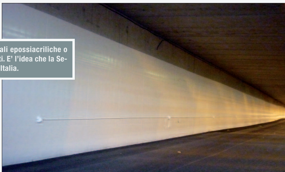
Figura 1 - La galleria Casellina sulla A1 (Firenze)

Per quanto riguarda i tunnel già esistenti, con pareti vecchie e con innumerevoli infiltrazioni di acqua, si è già individuato nella vernice a base di tempera l'optimum del rapporto qualità-prezzo per garantire la pulizia e il giusto esborso da parte degli Enti appaltanti.